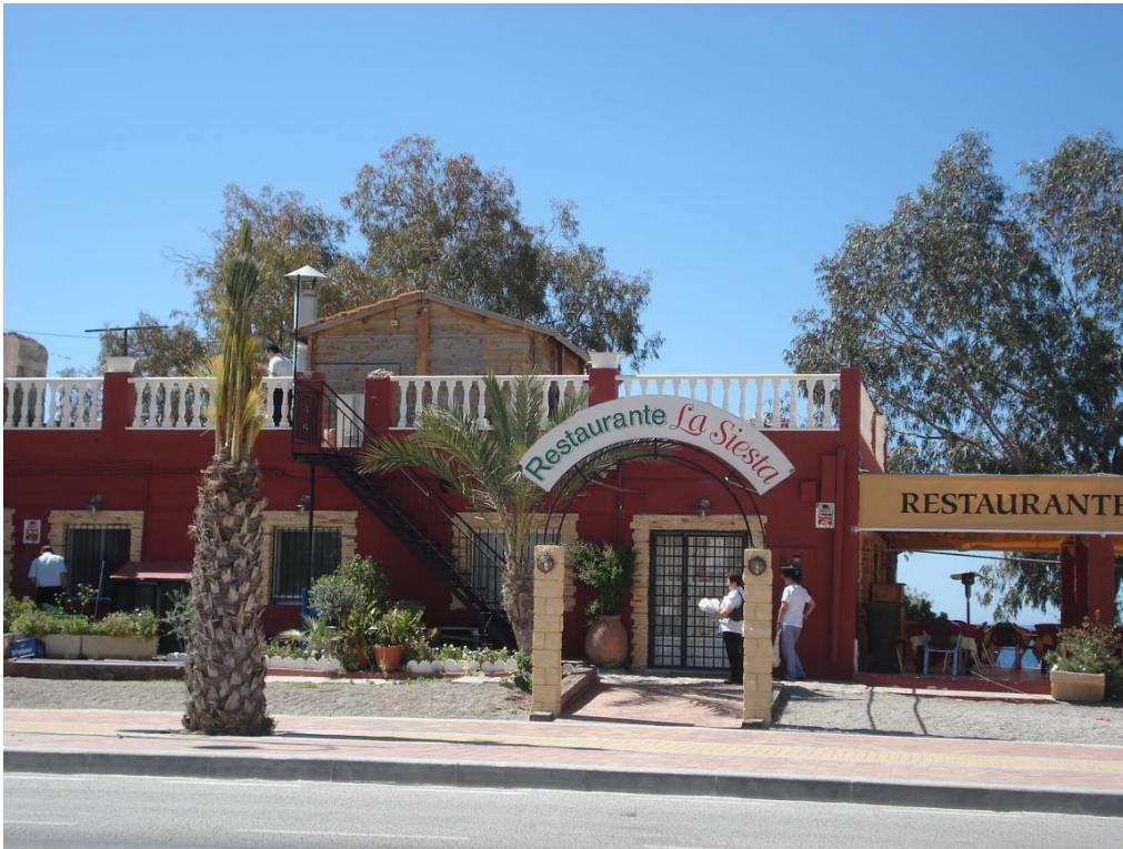
Bolnuevo, Restaurante "La Siesta".