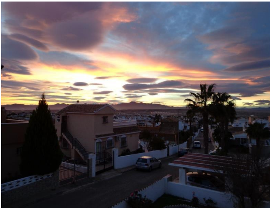
Zonsondergang vanaf het dakterras.