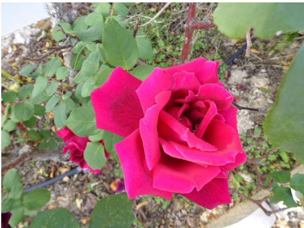
Naast palmbomen ook mooie bloemen.(december 2012)