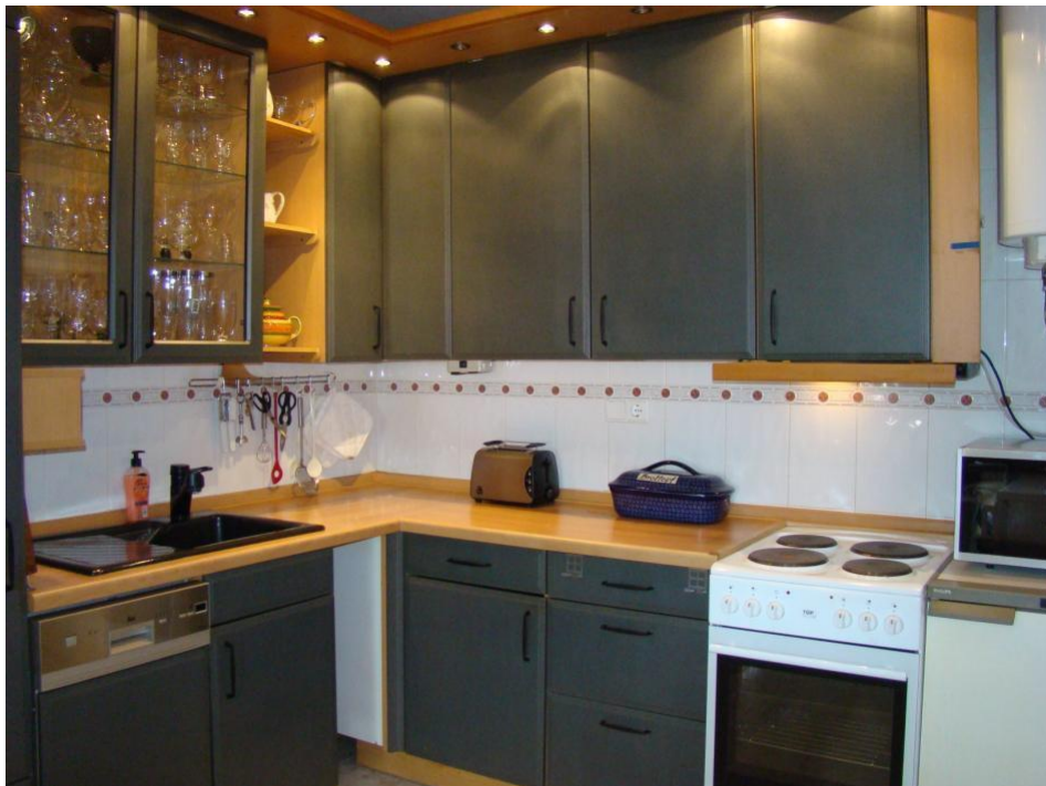
Keuken met alle inbouwapparatuur die gewenst is.

In Puerto de Mazarron zijn allerlei winkels (o.a. grote Mercadona, Lidl en Aldi) en leuke terrasjes bij de haven waar het goed toeven is. In Mazarron is een gloednieuwe Mercadona (zeer ruim gesorteerd).