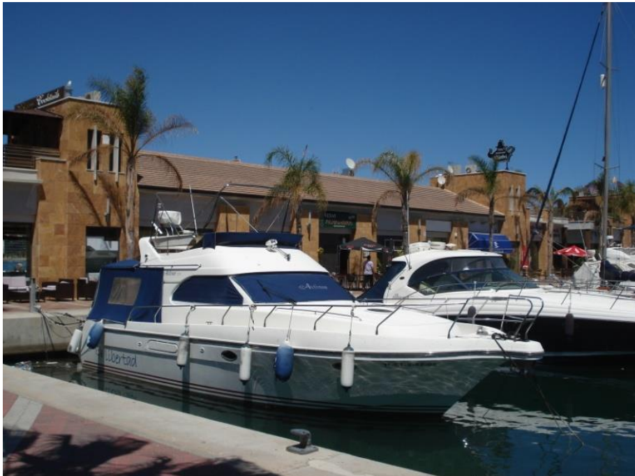
Puerto de Mazarron.(haven en terrassen)