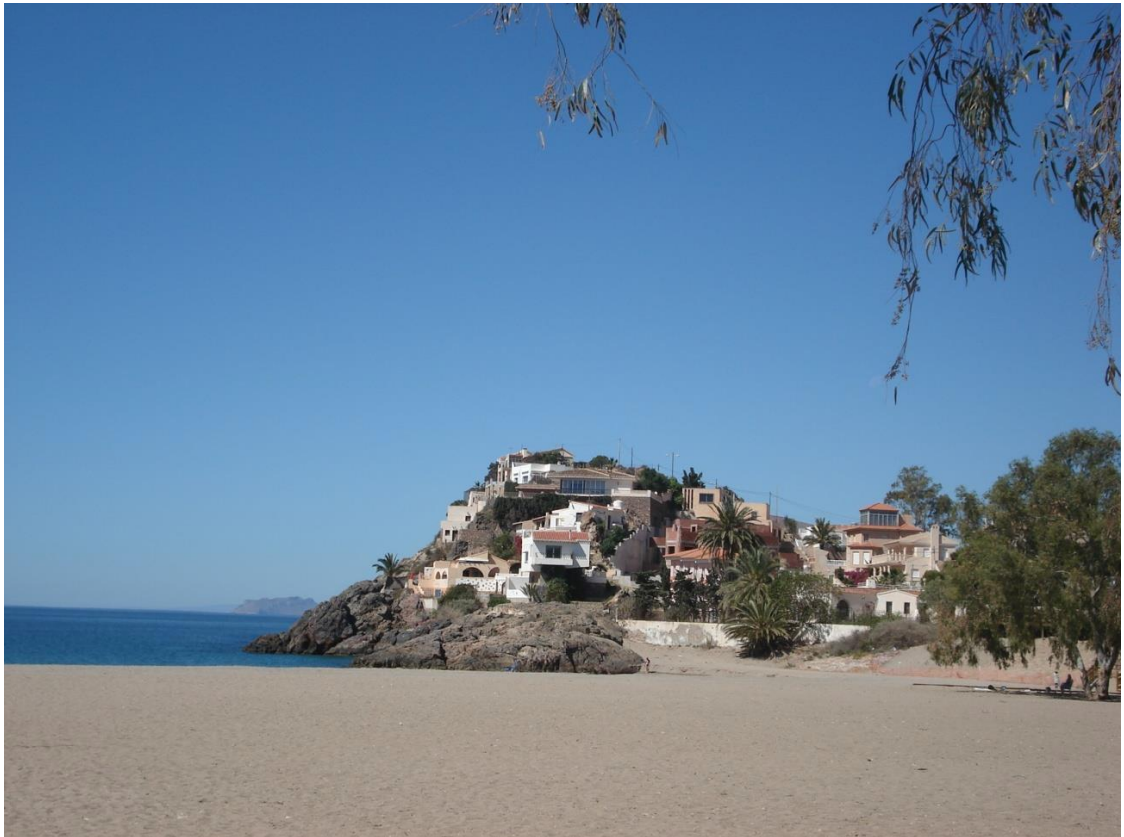
Bolnuevo. Zandstrand met super helder zeewater. Afstand tot het strand: +/- 10 min per auto. Puerto de Mazarron: zo'n 15 min. per auto.