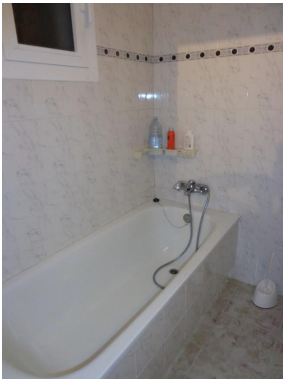
Badkamer met ligbad.

Via gangetje naar badkamer 1 (met douche, wastafel met bovenkastjes, toilet, wasmachine) Slaapkamer met 2-persoonsbed (150x200) en dekbedden, grote schuifdeurkast met boven- kasten, grote hang/legkast + nieuwe airco (warm/koud)