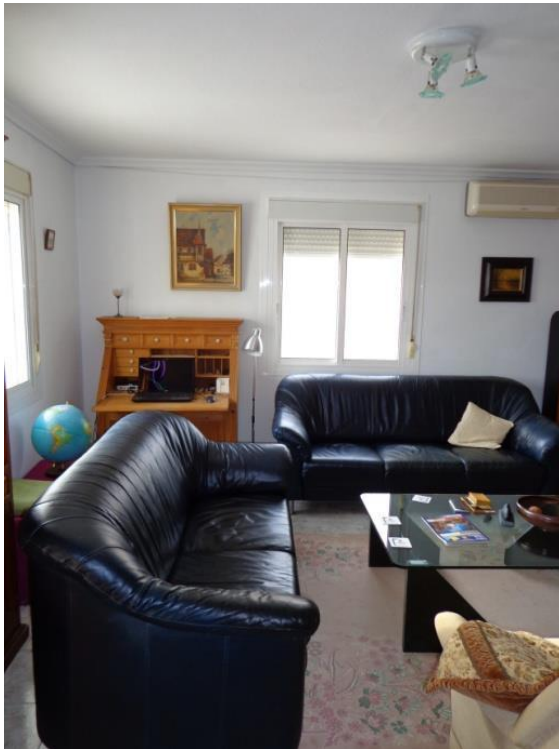
Woonkamer met leren bankstel.

Via gangetje naar badkamer 1 (met douche, wastafel met bovenkastjes, toilet, wasmachine) Slaapkamer met 2-persoonsbed (150x200) en dekbedden, grote schuifdeurkast met boven- kasten, grote hang/legkast + nieuwe airco (warm/koud)