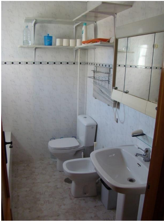
Toilet, bidet en wastafel

En-suite badkamer met bad, wc, bidet en wastafel met boven(spiegel)kasten en werkkast.