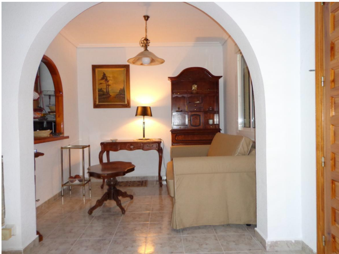
Kamer met slaapbank en doorkijk naar keuken

Woonkamer staat in open verbinding met de keuken waarin div. koel- en diepvrieskast(en), vaatwasser, boiler, elektrisch fornuis met oven, koffiezetapparaat, waterkoker, tosti-apparaat, combi-magnetron, broodrooster, potten, pannen, bestek, glaswerk, etc.