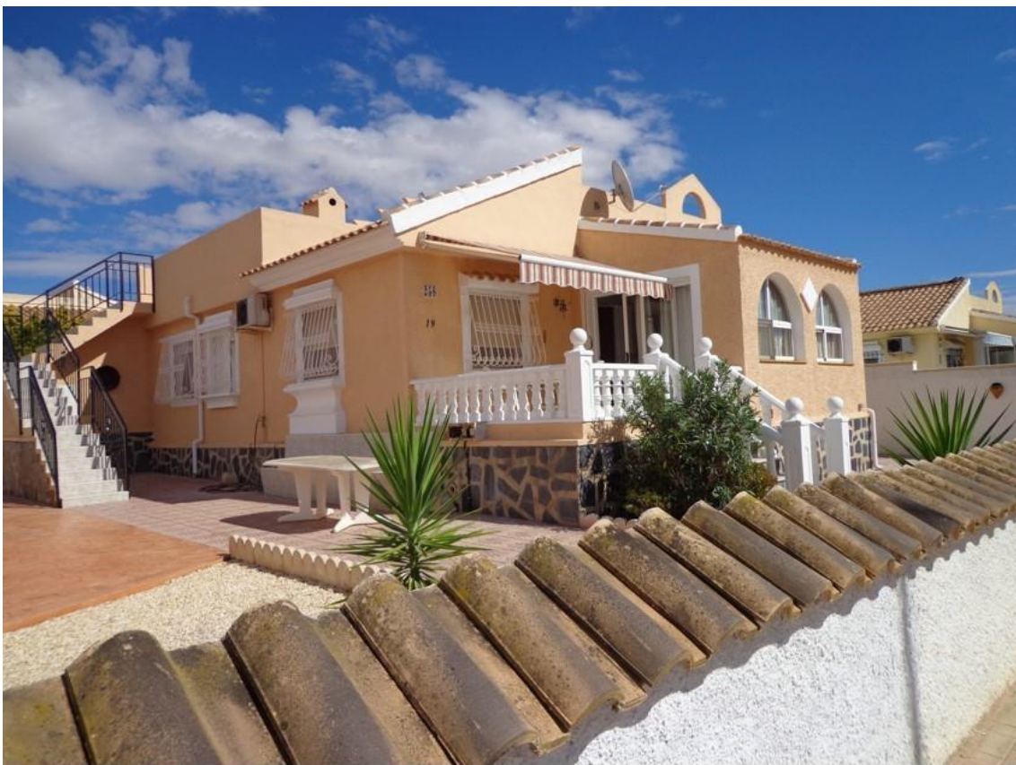
Huis met terras.

Voor u ligt een document over ons te huur zijnde vakantiehuis in Spanje. Dit om u een indruk te geven van het pand, de omgeving en het fijne verblijf aldaar. Het vormt een opsomming van informatie, prijzen en leuke weetjes uit de omgeving. Bij vragen kunt u altijd contact met ons opnemen via het bijgevoegde telefoonnummer op pagina 1 en 4.