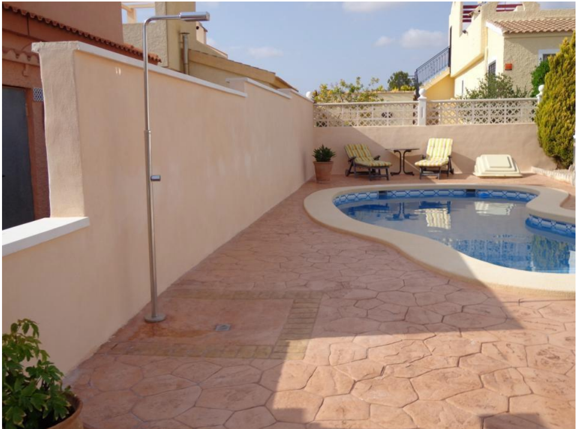
Zwembad met buitendouche