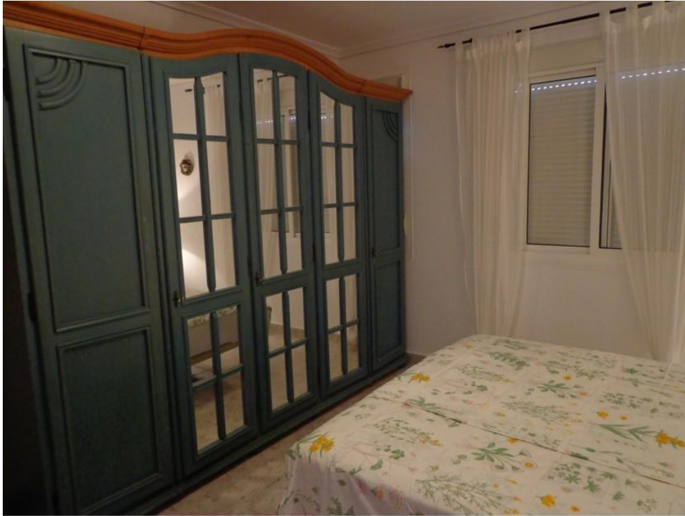
Slaapkamer met hang/leg kastenwand en schuifdeurkasten