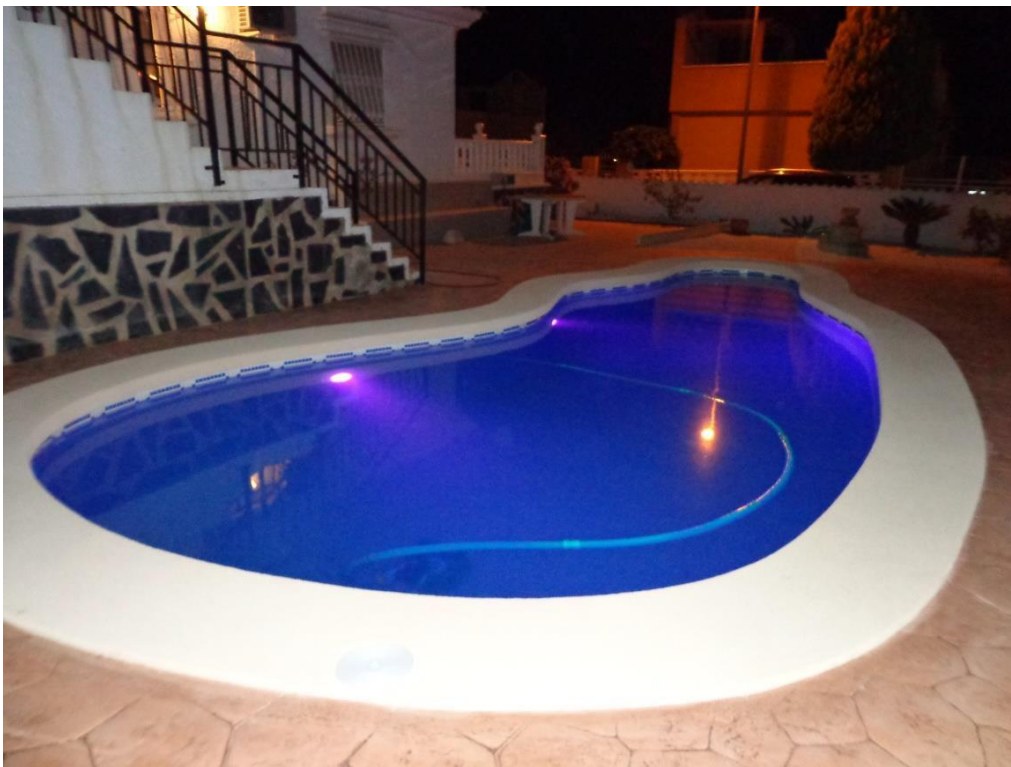
Zwembad "By night".